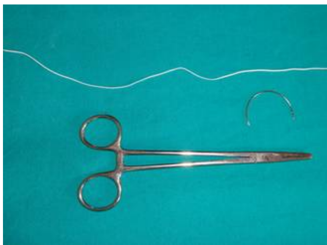
Materialele folosite: portac Hegar, ac Hagedorn, fir