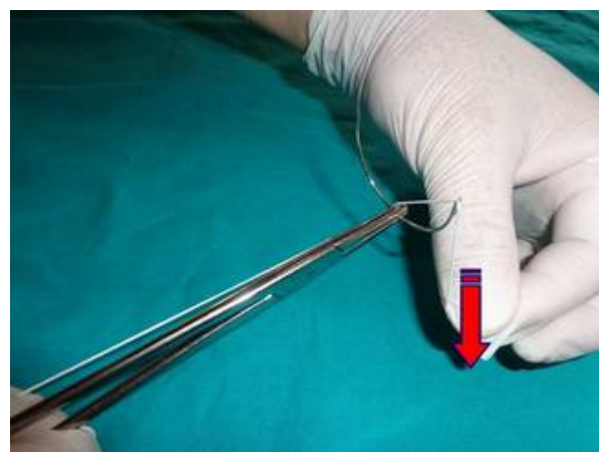
Se trage de fir, apăsându-l pe urechile acului în așa fel încât să treacă printre acestea în gaura acului.