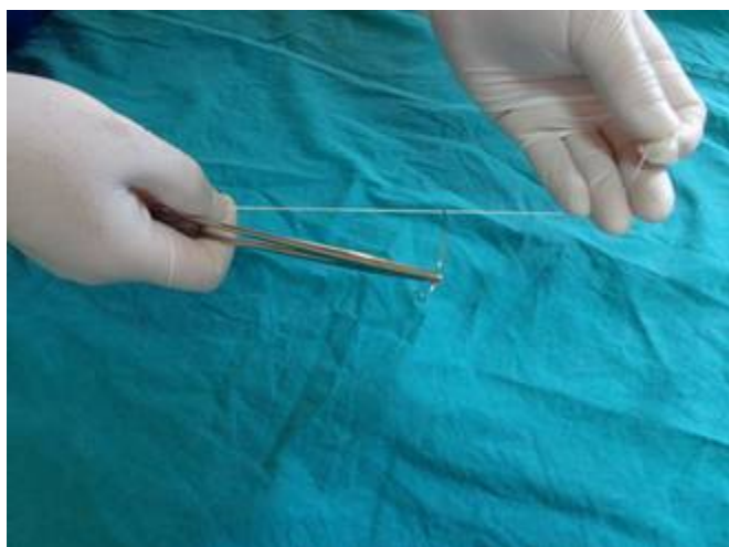
Firul se prinde cu aceeași mână în care se prinde portacul. Cu cealaltă mână se întinde firul de-a lungul portacului.