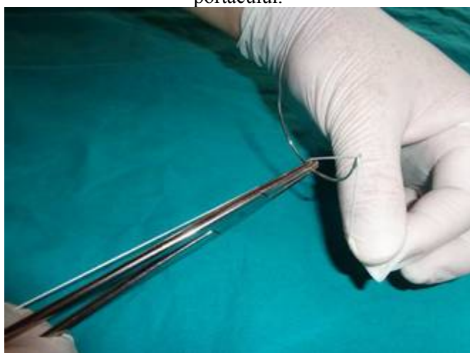
Se așează firul pe urechile acului.